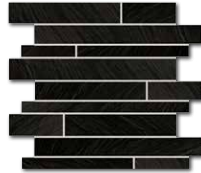
DDP44314 (SET) PEI 5 \odot 72 / set mat | matt | R10 | B | >