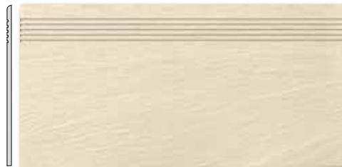
DCPSE313 PEI 5 \odot 72 / ks mat | matt | R10 | A