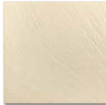
DAR44313 PEI 5 \odot 80 / m 2 mat | matt