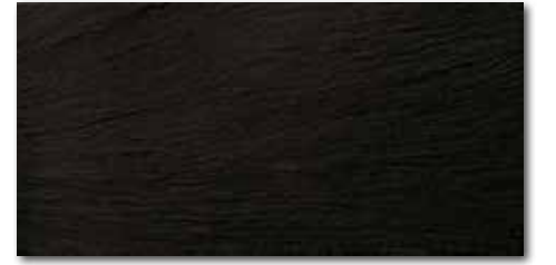
DARSE314 PEI 5 \odot 80 / m 2 mat | matt