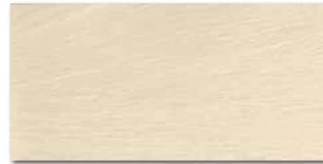
DARSE313 PEI 5 \odot 80 / m 2 mat | matt