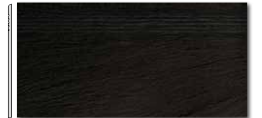
DCPSE314 PEI 5 \odot 72 / ks mat | matt | R10 | A