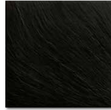
DAR44314 PEI 5 \odot 80 / m 2 mat | matt