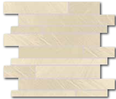
DDP44313 (SET) PEI 5 \odot 72 / set mat | matt | R10 | B | >